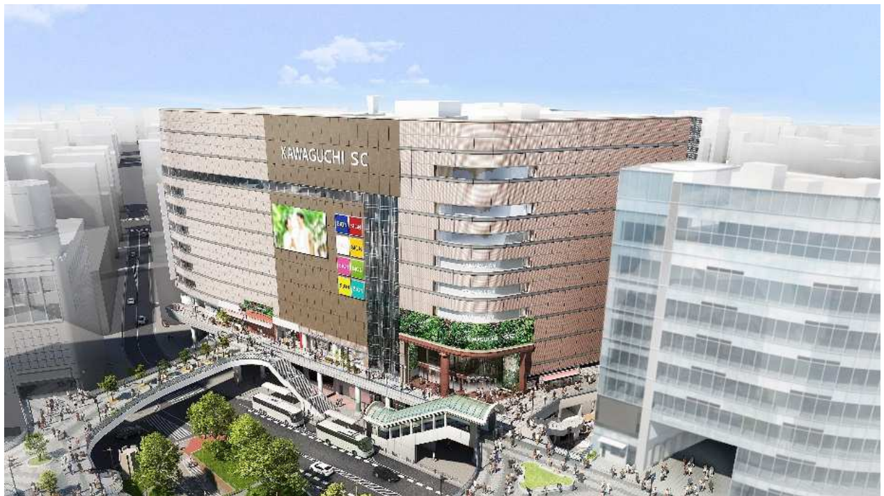
「(仮称)川口駅前商業施設計画」外観リニューアル イメージ

長く地域に親しまれてきた旧そごう川口店の特徴である大時計や大理石などを残しながら、魅力あふれる商業環境を創出すると同時に、アパレル・コスメ・生活必需品や生鮮・スイーツ等のグルメ店舗などバラエティ豊かな約100店舗を揃えることにより、駅前地区の更なる利便性と賑わいを向上させ、活気ある街づくりに貢献いたします。また、各店舗と連携した環境施策の実施など、持続可能な社会の実現にも取り組みます。