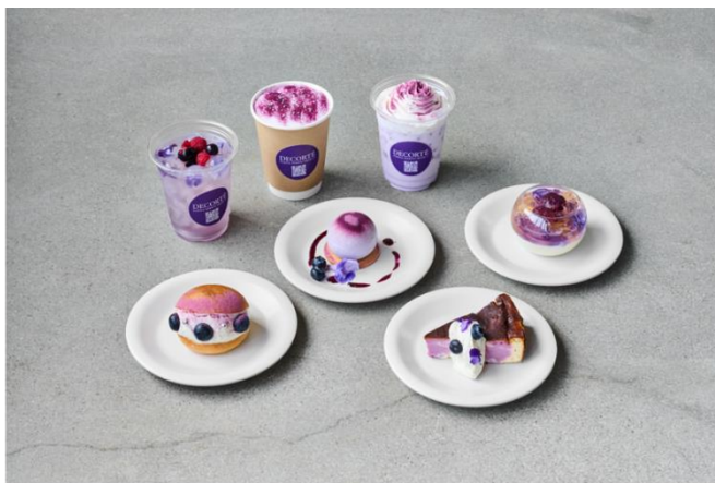
VALLEY PARK STAND コラボメニュー