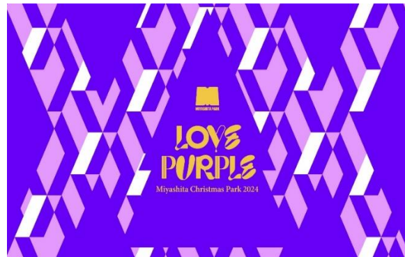
「MIYASHITA CHRISTMAS PARK 2024」キービジュアル