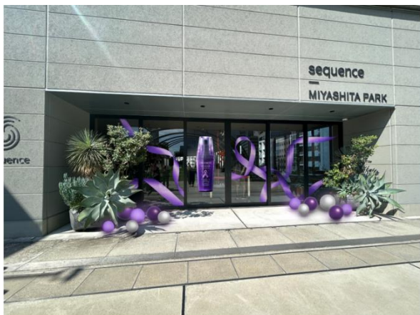
sequence MIYASHITA PARK エントランス付近

イルミネーションカラーであるパープルは、赤と青が混ざりあってできるカラーです。ダイバーシティの街・渋谷の中心であるここ MIYASHITA PARK で、多様な人々が混ざり合い、互いを認め合い、大切にしようことを表現しています。大切な人とここでしか味わえない特別なクリスマスをダイバーシティの街、渋谷 MIYASHITA PARK でお過ごしください。