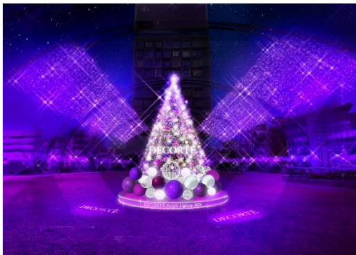
「DECORTÉ Purple Lightup 2024」イメージ

本年もコスメデコルテ協賛によるイルミネーション「DECORTÉ Purple Lightup 2024」を実施。メインのクリスマスツリーは、コスメデコルテのリポソームをイメージしたオーナメントが追加されるなど、昨年よりラグジュアリーなデザインにアップデートし、さらにクリスマスを盛り上げる空間に生まれ変わります。そのほか、DECORTÉ PURPLE RIBBON PROJECT(コスメデコルテ パープルリボンプロジェクト)とコラボレーションしたイベントやキャンペーンも実施。また、2024年の「LOVE PURPLE」のクライマックスを彩るのは、誰もが自分らしく楽しめる音楽イベント「LOVE PURPLE MUSIC NIGHT 2024」。多種多様な方が思い思いに過ごせるクリスマスのひとときをお届けします。ダイバーシティの街、渋谷 MIYASHITA PARK で、思いやり溢れる特別なクリスマスを是非お楽しみください。