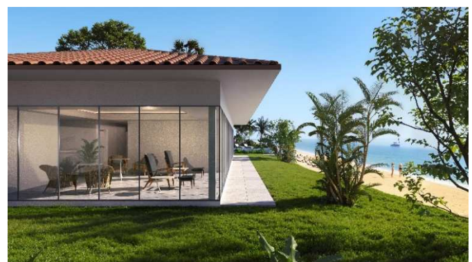
「The Spa(ザ・スパ)」外観イメージ