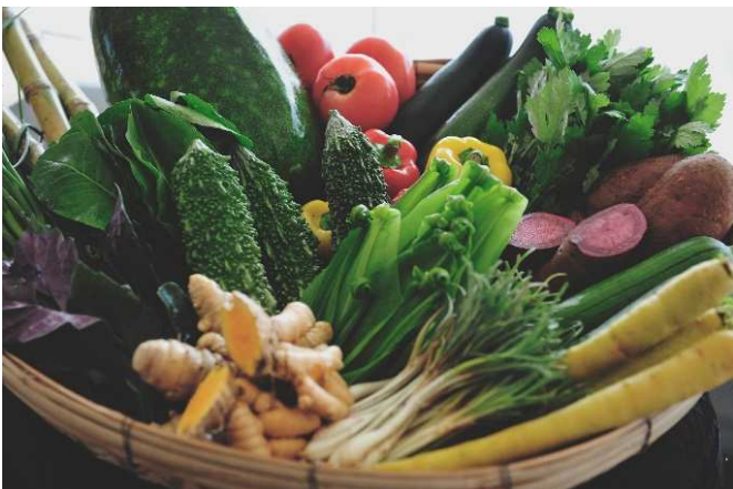
島内で収穫できる食材イメージ