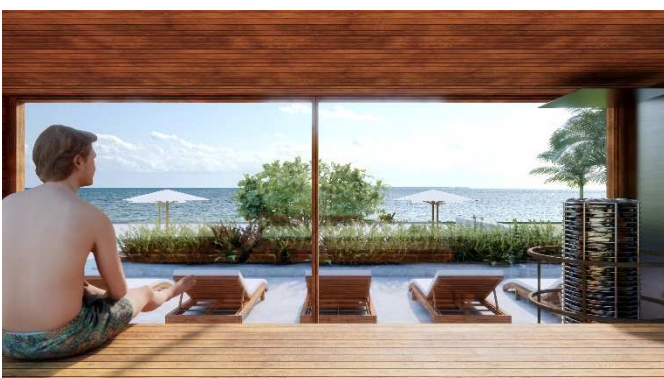
「SAUNA BLOCK(サウナブロック)」内装イメージ