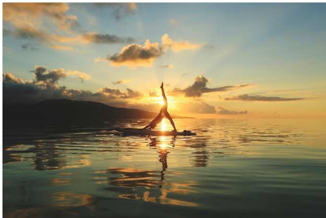
アクティビティ例「SUP」