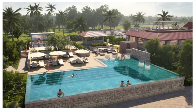
「Quiet Pool(クワイエットプール)」イメージ