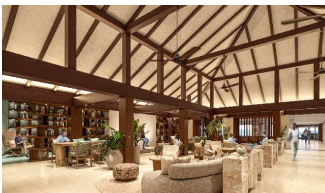
ライブラirieラウンジイメージ