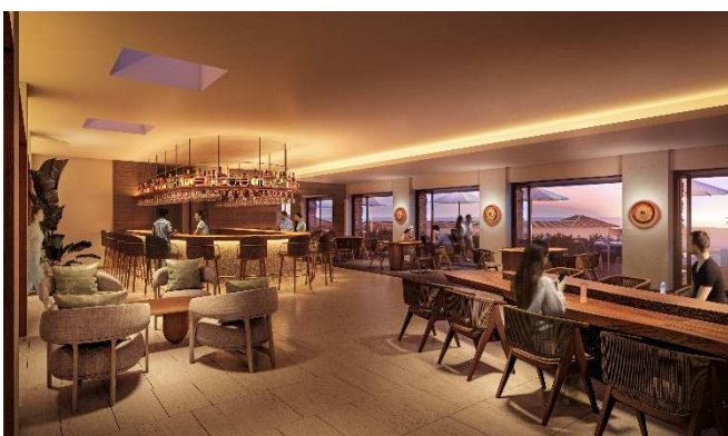
「The Lounge & Bar(ザ・ラウンジ&バー)」客席イメージ