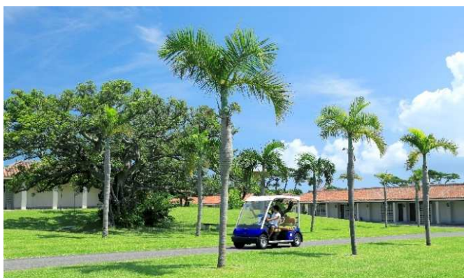
敷地内の散策に便利なレンタルカート