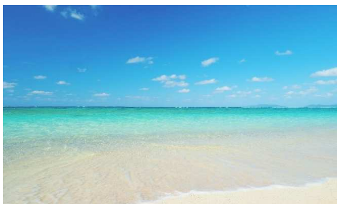
はいむるぶしビーチ