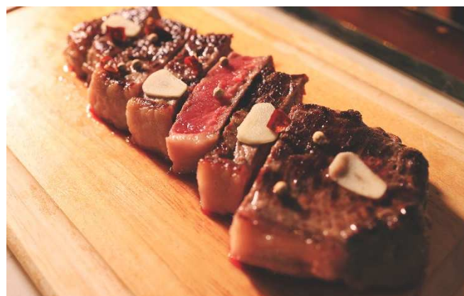
「The Steak & Grill(ザ・ステーキ&グリル)」料理イメージ