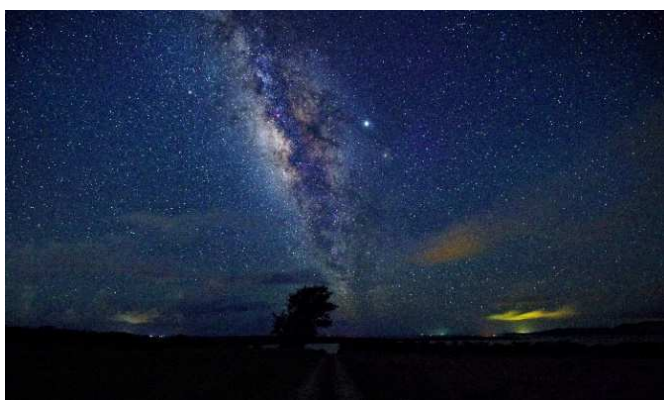
はいむるぶし敷地内から見える星空

宿泊期間： 2025 年 7 月 15 日～2025 年 11 月 30 日 販売期間： 2025 年 7 月 15 日まで(室数限定のため、販売期間内に終了する場合がございます) プラン内容： ご朝食付き 特典： ①リゾートクレジット 15,000 円/1室・1 滞在 リゾートクレジットは、レストランやスパリートメントにご使用いただけます。 ②レストラン利用時のワンドリンクサービス 対象客室： 全客室 予約方法： 公式サイトからのご予約 https://www.haimurubushi.co.jp/ お電話でのご予約 0980-85-3111(9:00-18:00)