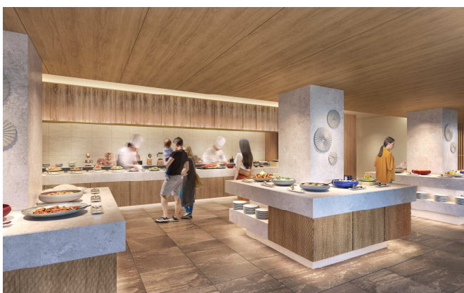
「The Buffet(ザ・ビュッフェ)」ライブキッチンイメージ