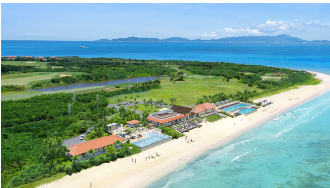
プール&ビーチエリア全景イメージ

※クワイエットプール、スパ棟、サウナ棟のオープンは、2025 年 8 月を予定しております。