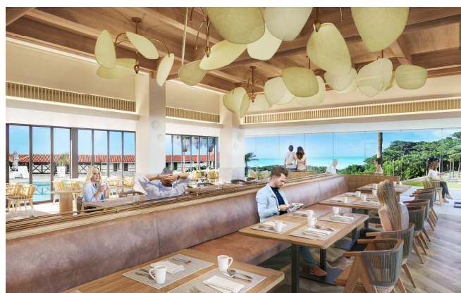
「The Buffet(ザ・ビュッフェ)」客席イメージ