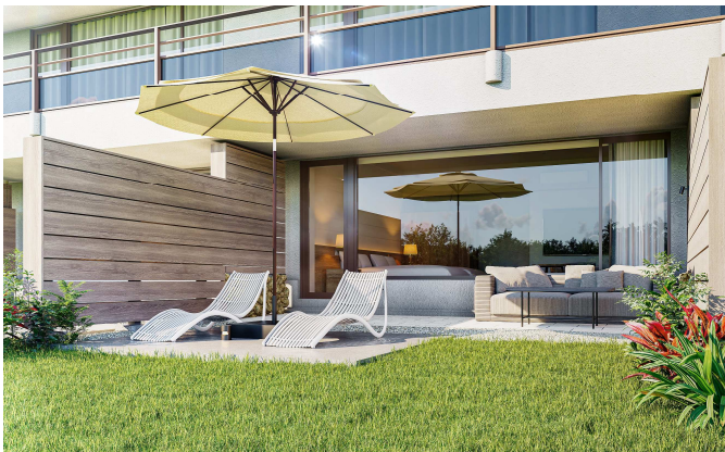
ガーデンテラスイメージ

敷地内に点在する琉球赤瓦が特徴的な宿泊棟に、プライベートガーデンを備えた「ガーデンテラス・プレミアムルーム」がリニューアルオープン。客室から見える八重山諸島の美しい景色を楽しんでいただけることはもちろん、プライベートガーデンにはリゾート感溢れる植栽を配し、サンラウンジャーでお寛ぎいただけます。また室内のデイベッドを利用することで、ご家族、グループ(最大 5 名様まで)でもゆっくりとご宿泊いただけます。プールやアクティビティでひと遊びした後のリラックスタイムを緑あふれるプライベートガーデンでごゆっくりお過ごしください。