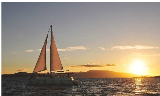
アクティビティー例「サンセットクルーズ」