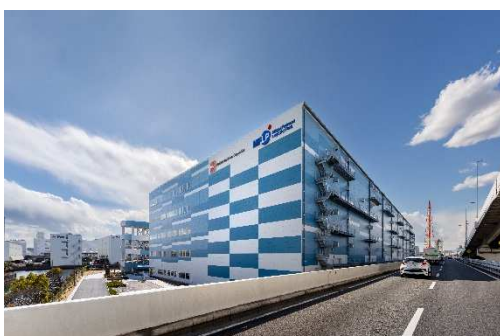
高速道路から見た外観

周囲の水辺の景色と調和するよう、2 種類の青色と白色を組み合わせたモザイク調の爽やかな外壁パネルを採用しており、高速道路からの視認性が非常に高いデザインです。