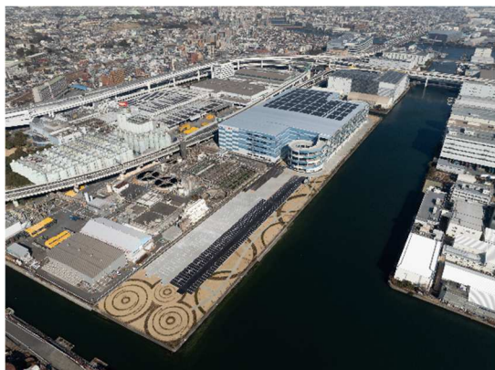
南西側からの外構鳥瞰

施設従業員が海面の光と海風を感じ、リフレッシュいただけるよう、敷地南西側の運河に面した部分に、約 6,000㎡の緑地を整備しています。「波紋の広場」と名付け、潮風に強いシンボルツリーのシマサルスベリの木を中心に低木と芝で波紋を表現しました。