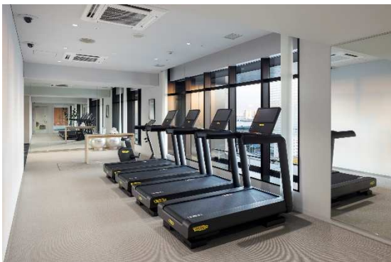
フィットネスルーム