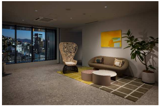
コミュニケーションラウンジ