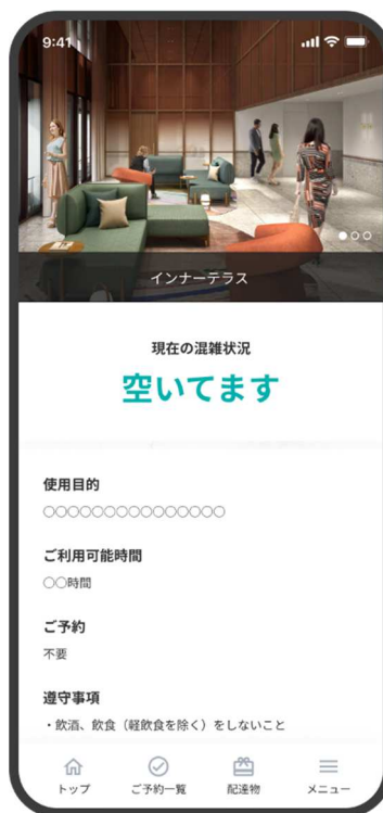
「スミカレジデンスアプリ」イメージ