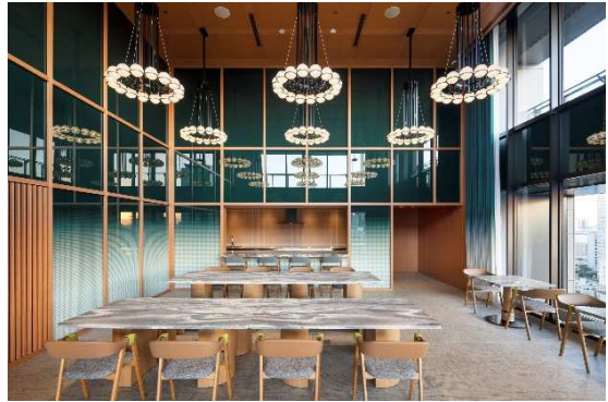
パーティールーム