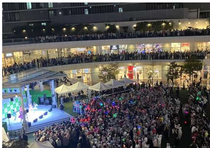
三井ショッピングパーク ラゾーナ川崎プラザ ルーフ広場でのイベント風景