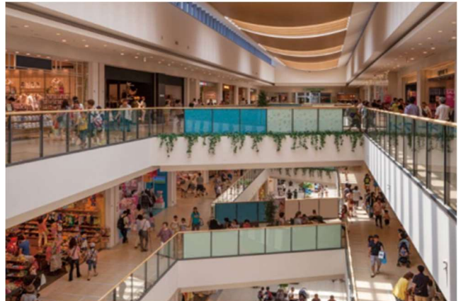
「ららぽーと横浜」 2025 年 12 月時点