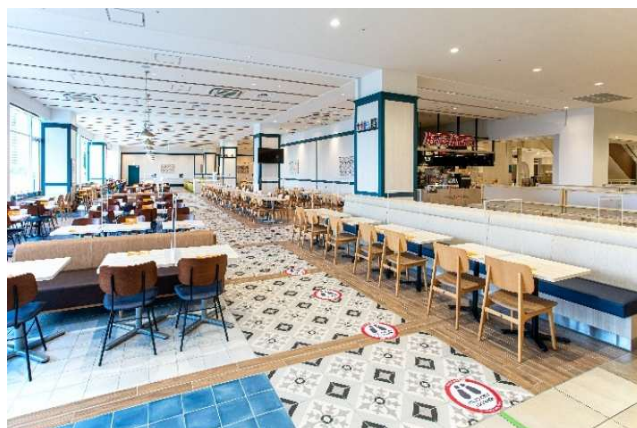
「アーバンドック ららぽーと豊洲」 2025 年 12 月時点