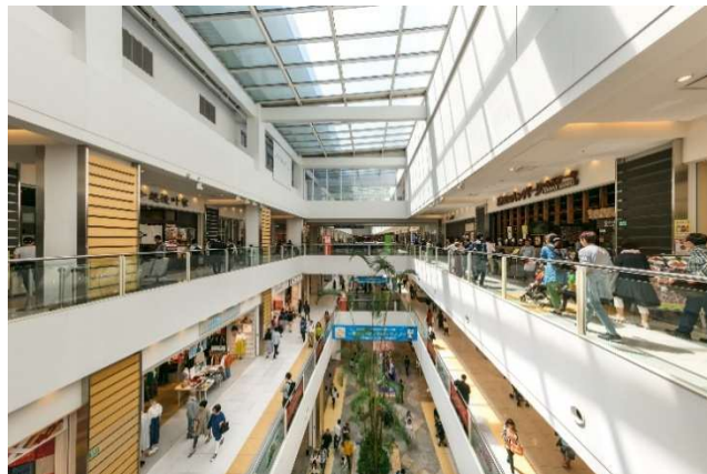
「ラゾーナ川崎プラザ」 2025 年 12 月時点