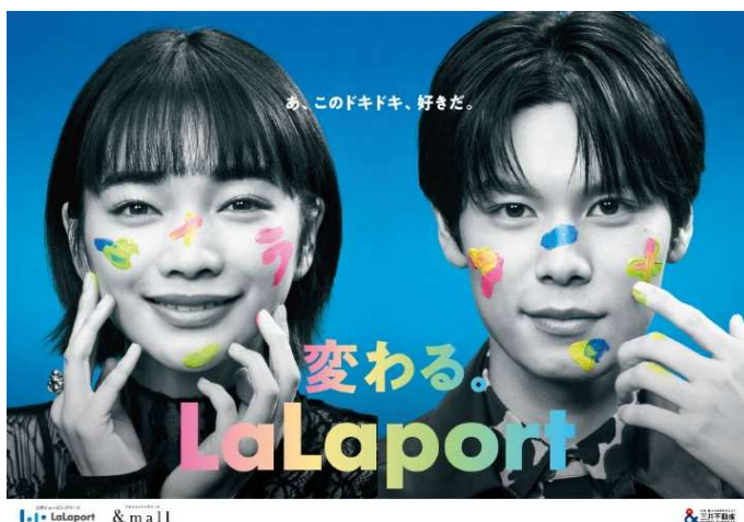
現在放映中のCM 三井ショッピングパーク ららぽーと「変わる。ららぽーと/プレイキン」編

各施設の具体的なリニューアル計画については、今後詳細が確定次第改めてニュースリリースにて発信いたします。