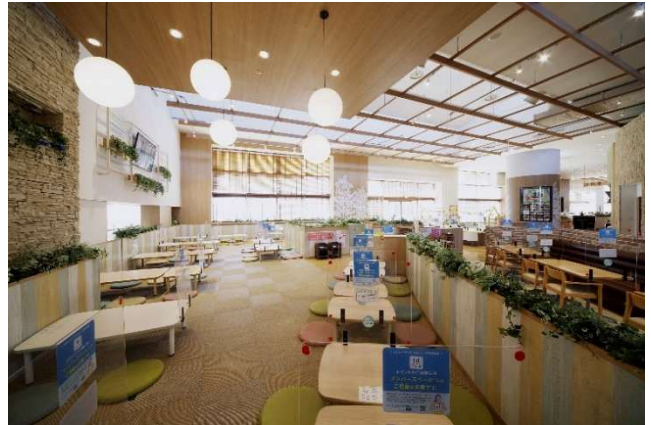
「ららぽーと柏の葉」 2025 年 12 月時点