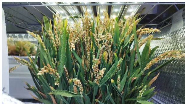
牛乳タンパク質を生成するイネ