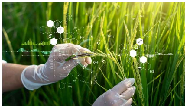
高さ 20cm の矮性イネを生育する様子

米国をはじめとする世界各国の方々に弊社の技術へ関心をお寄せいただき、貴重な縁を築くことができました。また、次世代の食料安全保障に対する切実な懸念を伺う中で、日本発のソリューションへ寄せられる期待の大きさを確信いたしました。今回の経験を糧に、Kinish のグローバル展開をさらに加速させてまいります。