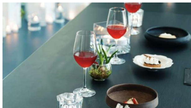
プレミアムノンアルコール飲料「ネイチャーカクテル」