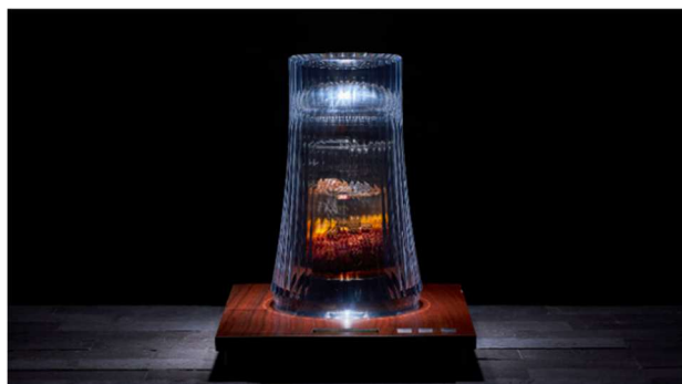
独自の冷温減圧技術を実現する抽出器

「&mog Food Lab」内にある「COLDRAW 日本橋抽出所」で研究開発を積み重ね、CES という国際的な場で COLDRAW の技術と取り組みを紹介できたことを嬉しく思います。植物素材の新たな可能性を引き出すイノベーションの一例として、多くの来場者から関心を寄せていただき、海外市場における可能性を改めて実感する機会となりました。今後もパートナーの皆さまと共に、持続可能で創造性の高い食の未来に貢献していきたいと考えています。