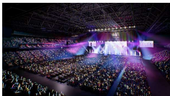
音楽コンサート利用時

ラグビーの試合はもちろん、ライブ・コンサートを中心とした各種イベントの開催が可能。50m×12m の大型ビジョンを設置し、多彩な演出を行うとともに、一つ一つの座席も前後左右のゆとりをしっかりと確保することで感動のエンターテインメント空間を創出します。約 2.5 万人規模の屋内全天候型多目的ラグビー場で、都心に位置することから平日の来場も容易となっており、国内外トップクラスのアーティスト公演によるエンタメの中心地となることを目指します。