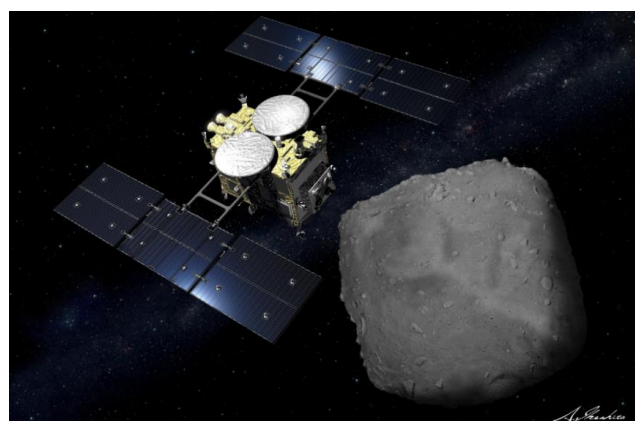
イラスト：池下章裕