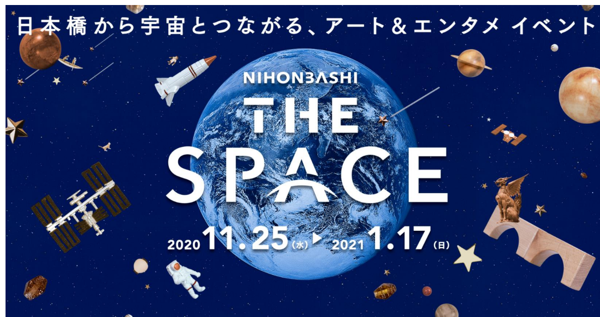
「NIHONBASHI THE SPACE」キービジュアル

当社は「日本橋再生計画」の重点構想「新産業の創造」の注力分野として「宇宙」を設定しており、日本橋には現在、「宇宙ビジネス拠点X-NIHONBASHI」や様々な宇宙関連企業が拠点を構えています。そうした拠点やプレイヤーの集積を背景に、今回初となるB to C向けイベント「NIHONBASHI THE SPACE」を開催する運びとなりました。日本橋では今後も、宇宙に関連するエンターテインメントや教育等、様々なコンテンツを展開していく予定です。（イベント特設サイト： https://nihonbashi-thespace.jp ）