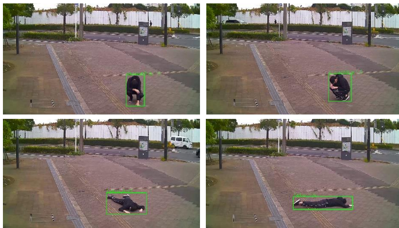
例:倒れ、うずくまり時の検知画像

独自に CG シミュレーションを活用し多様なデータを学習させた物体認識により、夜間でも高い AI 検知精度を実現します。