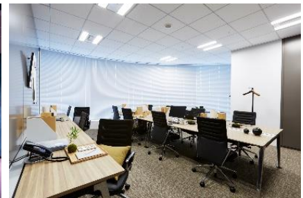
ワークスタイリング FLEX (ワークスタイリング東京ミッドタウン日比谷)

※ ワークスタイリング公式ホームページ: https://mf.workstyling.jp/