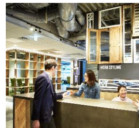
コンシェルジュによる有人管理