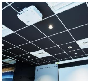
サウンドマスキング