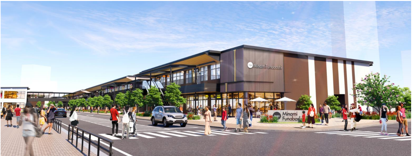
外観イメージ(西側より)

効率的なエネルギー運転管理や省エネアイテムの導入等により、CO2 排出量の削減をはじめとした ESG 課題の解決に取り組んでまいります。