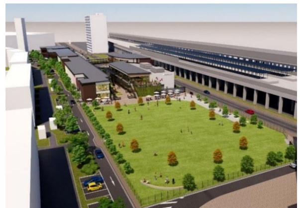
広場 鳥瞰イメージ(東側より)