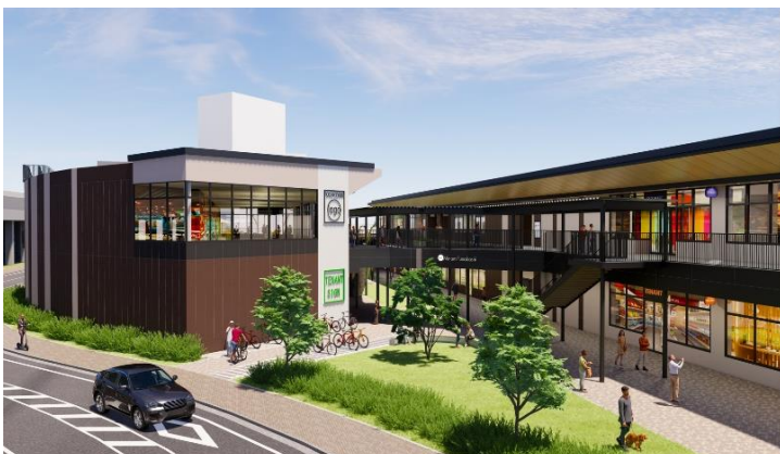
外観イメージ(北西側より)