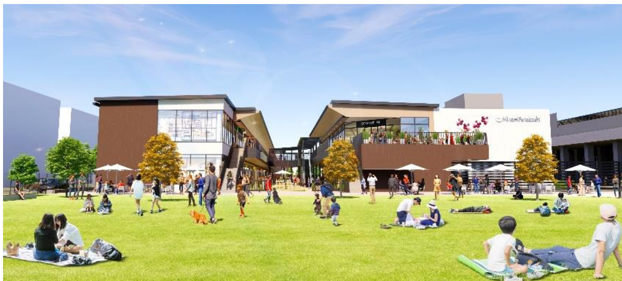
外観イメージ(東側より)

地域居住者の日常の憩いの場となる約5,000㎡もの大規模な広場空間と、デイリーニーズに応じた約40店舗を揃え、コミュニティの拠点として魅力あふれる商業環境を創出し、活気ある街づくりに貢献いたします。また、効率的なエネルギー運転管理等によるCO2排出量の削減など、持続可能な社会の実現にも取り組みます。