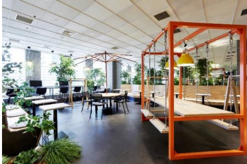
ワークスタイリング SHARE オープンスペース

全国に広がる拠点を 10 分単位で利用可能な法人向け多拠点型シェアオフィス『ワークスタイリング SHARE』、多様化する企業のニーズや様々なビジネスシーンに合わせた法人向けフレキシブルサービスオフィス『ワークスタイリング FLEX』を展開しています。2017 年 4 月よりサービス開始し、2020 年 9 月 10 日(木)時点で 63 拠点を開設しています。