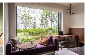
三井ガーデンホテル 豊洲ベイサイドクロス