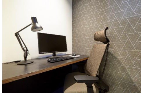
ワークスタイリング SHARE 一人用個室