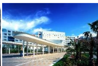
三井ガーデンホテル プラザ東京ベイ