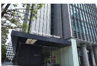
三井ガーデンホテル 銀座プレミア