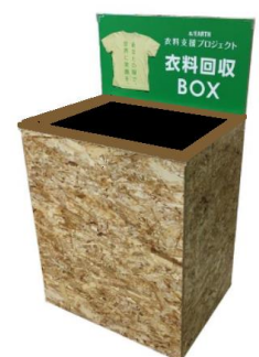
前回の衣料品回収風景(2022年10月)