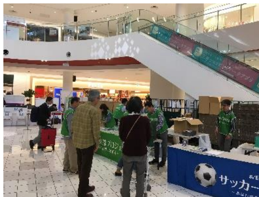
会場でのサッカー用品回収の様子