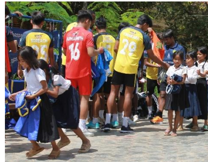
カンボジアでのサッカー用品寄贈の様子(2022 年 9 月)