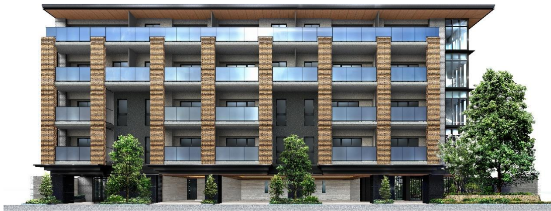
【外観完成イメージ】