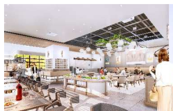
Cafe & Restaurant CENTRALE 内観 CG