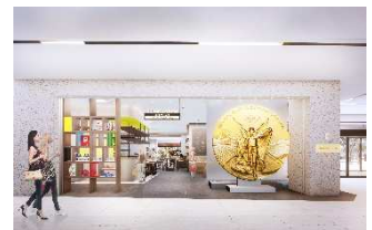
メインエントランス CG(展示エリア側)

本施設は、三井不動産レジデンシャルが「オリンピズムが浸透した社会の実現」を目指す公益財団法人日本オリンピック委員会(以下、JOC)に全面的に協力し、設置が実現したものです。JOC のオリンピック・ムーブメントの発信拠点である「日本オリンピックミュージアム」のサテライトとして、東京 2020 大会選手村の地に大会を象徴する展示や、選手村でも提供された食材を活用したレストラン、各種プログラムを展開し、大会のレガシーを継承します。