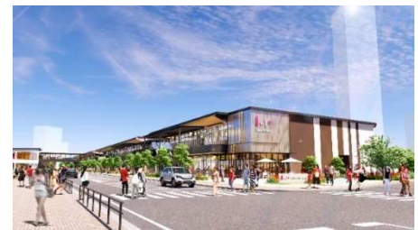
「ららテラス TOKYO-BAY」 外観イメージ

JR 南船橋駅前で開催を推進してきた本施設は、「&MORE 暮らしにもっと便利さを、毎日にもっとおいしいを。」のコンセプトのもと、帰りがけについ足を運びたくなる生活利便性の高い店舗を中心に全 36 店舗が出店するほか、ドッグランや遊具広場を備えるだけでなく、フードフェスやスポーツのパブリックビューイングなど様々なイベントの実施を予定している約 5,000 ㎡の大規模広場も整備し、憩いとくつろぎの場を提供します。