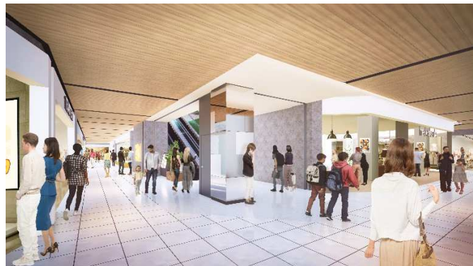
「ららテラス HARUMI FLAG」 内観 イメージ

スーパーマーケットを核として、生活利便性の高い物販店舗やサービス店舗を提供するほか、晴海エリア最大規模の「食」のフロアを展開