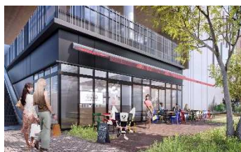
外観 CG(Cafe & Restaurant CENTRALE 側)