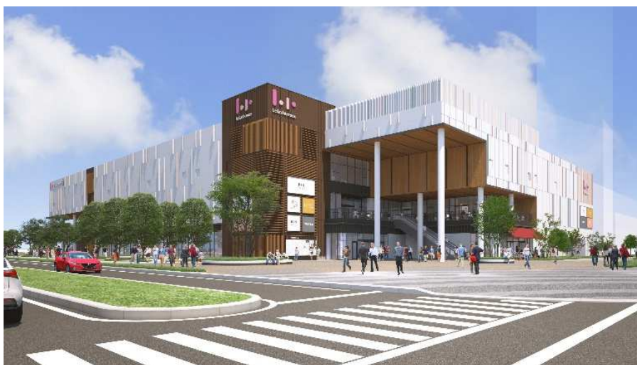
「ららテラス HARUMI FLAG」外観 イメージ

また、同じライフスタイル型商業施設「三井ショッピングパーク ららテラス TOKYO-BAY」(千葉県船橋市)が 2023 年 11 月 29 日(水)にグランドオープンすることが決定しました。本日プレスリリースを発表しておりますので、あわせてご覧ください。