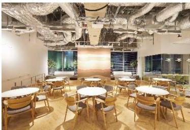
ワークスタイリングSHARE (ワークスタイリング 東京ミッドタウン八重洲)

「ワークスタイリングFLEX」：1席からハイグレードビルにオフィスを持てるレンタルオフィス