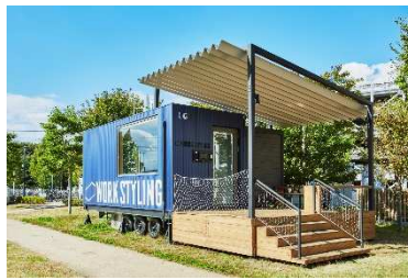
ワークスタイリングSOLO (ワークスタイリングSOLO 柏の葉)