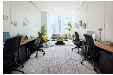
ワークスタイリングFLEX (ワークスタイリング大手町)

※ワークスタイリング 公式ウェブサイト： https://mf.workstyling.jp/