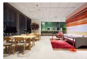
ワークスタイリング東京ミッドタウン八重洲 (八重洲セントラルタワー)