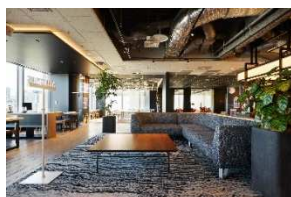
ワークスタイリング東京ミッドタウン(六本木) (ミッドタウン・タワー)