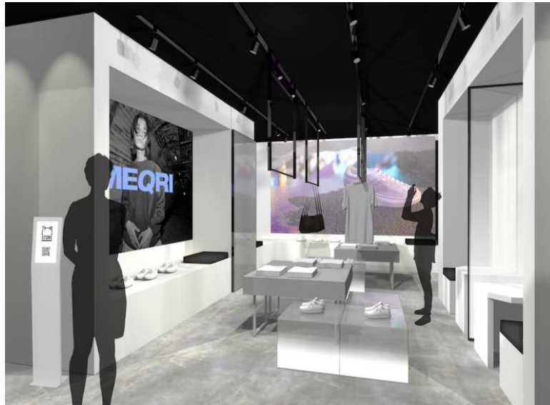
THE [ ] STORE 店舗イメージ

THE [ ] STORE は、SUPER STUDIO と三井不動産が EC/D2C ブランドへ提供する OMO ソリューションのひとつです。来店者は自らのスマートフォンを使って二次元バーコードから商品を購入できます。出店する EC/D2C ブランドは、オンラインだけでなく、オフライン(リアル店舗)での購入データも SUPER STUDIO が提供する統合コマースプラットフォーム「ecforce」で一元管理できるため分析がしやすく、顧客体験を向上するための CRM 施策などに活用できます。