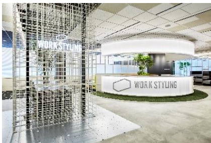
ワークスタイリング SHARE (ワークスタイリング六本木一丁目)

10分単位で利用可能な法人向け多拠点型サテライトオフィス「ワークスタイリング SHARE」、郊外エリアを中心とした法人向け個室特化型サテライトオフィス「ワークスタイリング SOLO」、多様化する企業のニーズや様々なビジネスシーンに合わせた法人向けフレキシブルサービスオフィス「ワークスタイリング FLEX」を全国 92 拠点で展開しています。三井不動産グループが提供する国内全 38 か所の「ザ セレスティンホテルズ」「三井ガーデンホテルズ」「sequence」提携拠点および今般「東京ドームホテル」が加わり、2021年5月末時点で131拠点を展開しています。多様なワークスタイルを提供する法人向けサービスとして、新たな働き方や生産性の高い働き方をサポートしています。