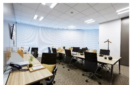
ワークスタイリング FLEX (ワークスタイリング東京ミッドタウン日比谷)

※ ワークスタイリング公式ホームページ: https://mf.workstyling.jp/