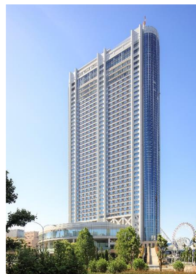
東京ドームホテル 外観