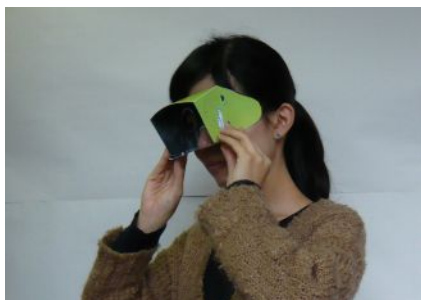
こどもの視野を体験し、こどもを守る視点につなげるワークショップ