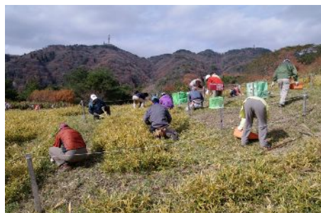
草原面積の縮小を食い止め、ススキなどの草原植物が生息する環境を守る