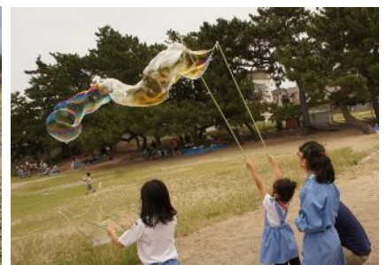
浜で思いきり遊び、浜の良さを体験することで、昔ながらの浜の景観を守る動きへ