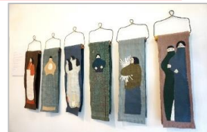
2020年 2人展「小さじ、すりきり一杯」 doremifa / 東京