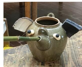
ケイゾーさんのソウ 第4回むらくもゴドモアート 2019年 やきものを变身させて楽器を作ろう 篠山チルドレンズミュージアム