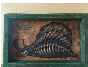
アメフラシ骨格図 2018年 ないしょのはなし。 神戸クリスタルタワー2 階県民ギャラリー