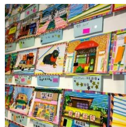
「兵庫景」展示風景 2019