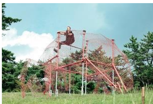
「Exuvia」六甲ミーツ・アート 芸術散歩 2019