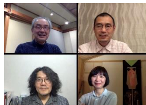
兵庫教育大学ひょうごもんプロジェクト研究会

2018年頃より大学内外の有志により兵庫県内の産業活動の中で出来た余剰品、端材などを収集し、造形活動のための素材化などを検討し始め、以後、素材の収集や題材研究、ワークショップの開催を行う。