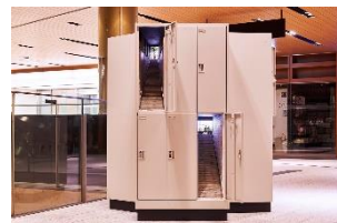
東京的遭遇-六本木 2015年 ミッドタウンアワード 2015 東京ミッドタウンプラザ B1