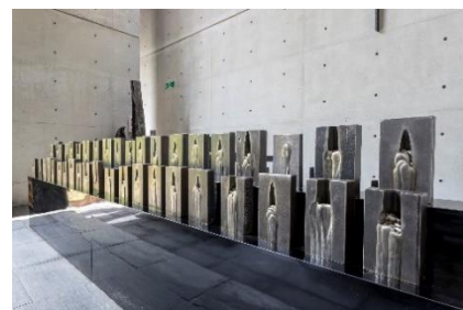
榎忠《End Tab (エンドタブ)》 2019年 風の教会