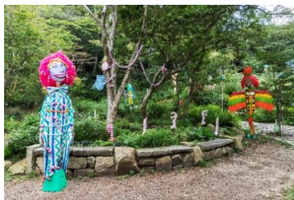
秦まりの《MAHOU NO MORI》 2019年 六甲オルゴールミュージアム