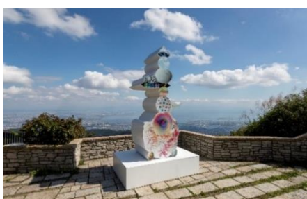
植松琢磨《world tree II》 2019年 六甲ガーデンテラス

六甲山のエリア特性をじっくりと読み込み、自然や景観、歴史を採り入れた作品を各会場に展示します。