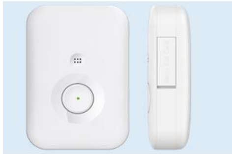
33mm × 57mm × 15mm / 重量：34g