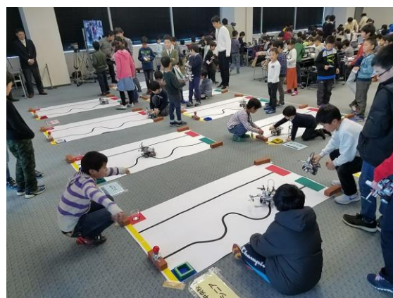
&lt;プログラボオリジナルコンテストの様子(2017年)&gt;