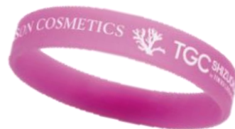
第二弾：SANGO BAND活動 チャリティーリストバンドを販売