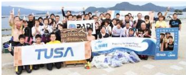
第一弾：ビーチや海中の清掃イベントへの協賛

現在、世界中の海でサンゴが白化し死滅する現象が問題視され、地球温暖化による海水温上昇などの環境要因だけでなく、一般的な日焼け止めに含まれている「紫外線吸収剤」という化学物質もその一因と言われています。このような状況を受けて、従来より紫外線吸収剤不使用の日焼け止め『シャンソン UVプロテクト ミルク』を販売しているシャンソン化粧品が、「肌と海にやさしい日焼け止めを選ぶ大切さ」を伝えるために2019年7月に発足したプロジェクト。様々な活動を通じて、サンゴ礁の保全活動を支援しています。