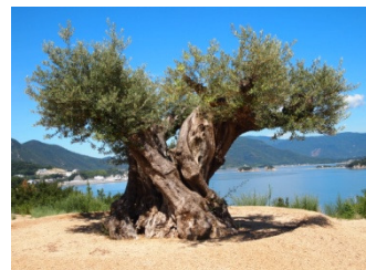
樹齢1000年のオリーブ大樹 (当社オリーブの森 EAST)