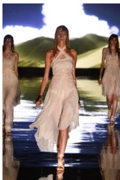
「Ungrid」 Long for Oasis