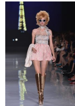
「Chedel」 Lady up Love