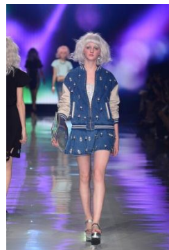
「EVRIS」 ECCENTRIC CHICK