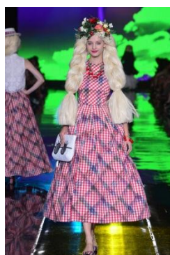
「elianegigi」 miss sunshine