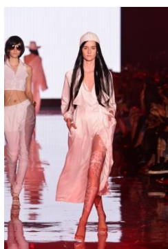
「GYDA」 milk Me