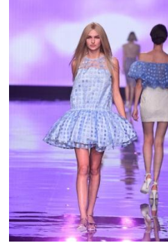
「MERCURYDUO」 New Natural