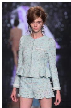
「prix de fleur」 Crystal Palette