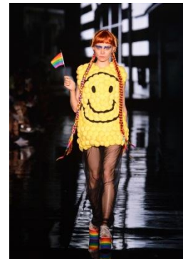
「jouetie」 RAINBOW PUNK!