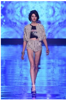
「LagunaMoon」 WELCOME ABOARD