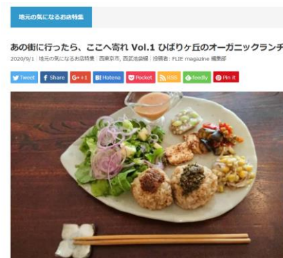
▲FLIE magazine / 新連載企画キャプチャ

新型コロナウイルス感染拡大により、売上が大きく落ち込んだ、またはやむを得ず閉店を余儀なくされた地域の個人店舗が多く存在します。そのような状況下でFLIE(フリエ)では、様々な地域の不動産をご紹介するプラットフォーム運営者として、その土地ならではの魅力を持ったお店を紹介することで「個性を持つ地元のお店を応援したい」という思いから本企画をスタートいたしました。