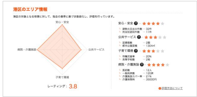
レーティング情報