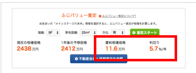
賃料相場価格と利回り情報