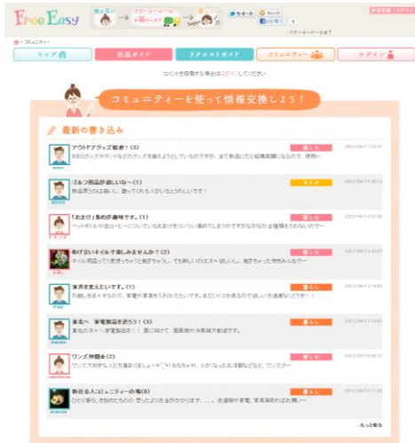
コミュニティ TOP 画面

自分と同じ趣味を持つユーザーを探す際にとっても役立つのが「コミュニティ」です。コミュニティは、ある話題について興味を持つユーザーが集まる掲示板です。自分では「マニアック」だと思っているような趣味でも、その趣味のコミュニティに参加すれば全員が「共通の趣味」の持ち主ですので、身近な友人では持っていないような情報や商品の交換などが可能になります。