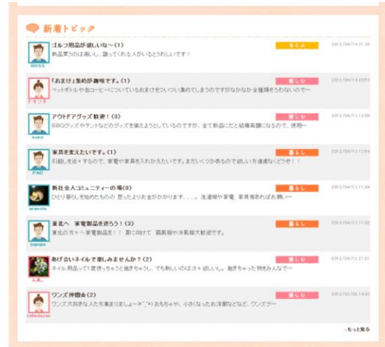
コミュニティ TOP 画面