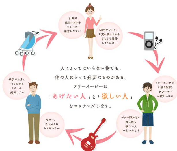
フリーイージーとは？ 画面より

「Free Easy」は、そんな「あげたい人」と「欲しい人」をマッチング致します。出品する方は“無料”で、リクエストする方は“送料のみ”ご負担頂くことで利用でき、取引成立後は、事務局が出品者への“送料支払い”から“荷物の引き取り、梱包、配送”まで一括してサポート致します。