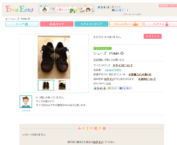
出品アイテム詳細、リクエスト画面