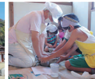
うどん作り体験の様子