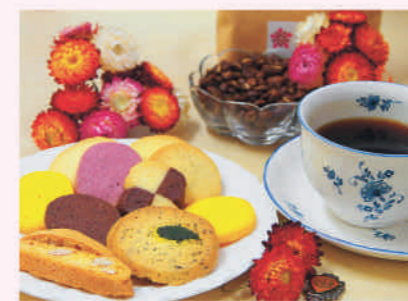
自家焙煎コーヒーセット