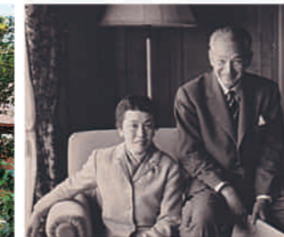
白洲正子(左)と白洲次郎(右)