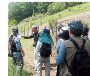
ガイドウォークの様子