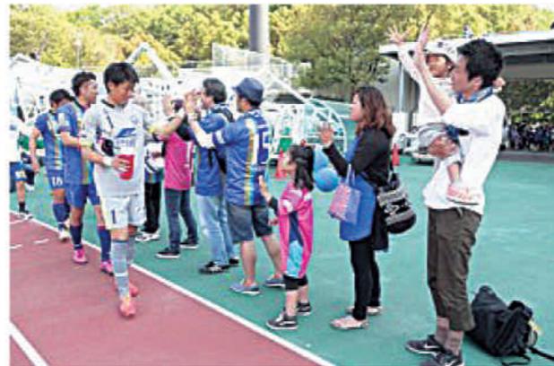
バックヤード見学ツアーのイメージ