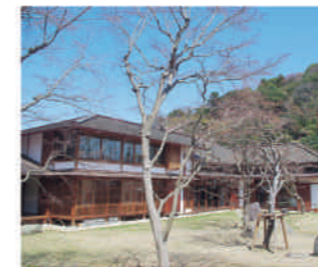
小野路宿里山交流館外観