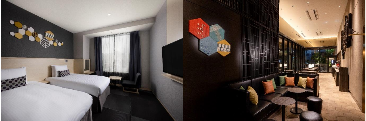
デラックスツイン（琉球畳）

ホテルは観光・ビジネスどちらの目的にも適した好立地に所在し、「新富町」駅から徒歩3分、「八丁堀」駅から徒歩4分、「銀座一丁目」駅から徒歩7分、「東銀座」駅から徒歩9分など、銀座だけでなく東京駅、日本橋、築地など都内各所へ徒歩で訪れることができます。