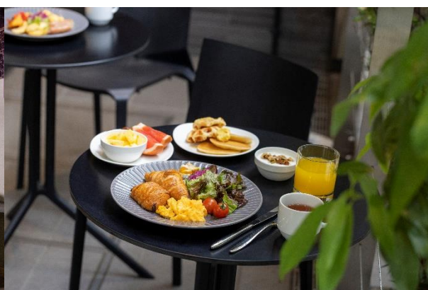
レストラン テラス席

また、オープンを記念する「朝食無料 オープニングオファー」を 8 月 31 日 (木) まで実施中。アコーのライフスタイルを重視したロイヤリティプログラム ALL - Accor Live Limitless のメンバーは、リワードポイントがたまるほか、朝食以外のお時間でも、ラウンジスペースとして無料で「杏」にアクセスいただけます。ラウンジでは高速無料 Wi-Fi、コンセント、そしてお飲み物をご用意しており、天気の良い日にはオープンエアのテラス席で、風を感じながら素敵なひと時をお過ごしいただけます。