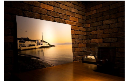
オーナーがスコットランドで 買い付けてきたアイラモルトが多数揃う