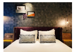
デラックスクイーン

Nespresso コーヒーマシン/TWG 紅茶/メルキュールオリジナルアメニティー