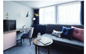
プリビレッジツイン