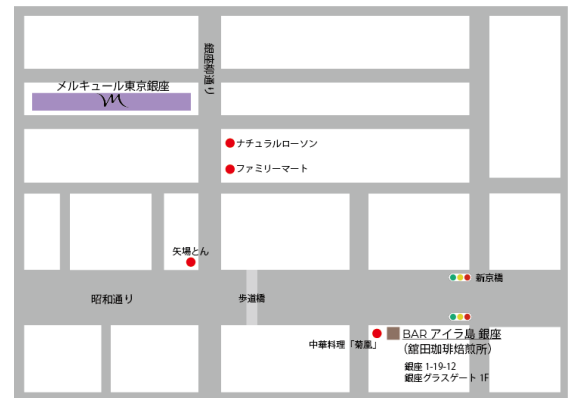
「BAR アイラ島 銀座」は当ホテルから徒歩 5