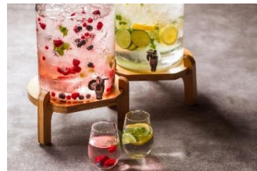
ビネガードリンクイメージ

湯上がり後にドリンクでのどを潤し、ソファでくつろげる空間です。20:00～22:00の時間帯では、甘酒も提供します。旅の疲れを癒す、ゆったりとした時間を過ごせます。