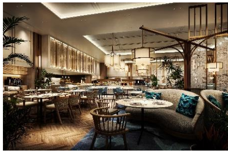
グランドメルキュール沖縄残波岬リゾート レストランイメージ

海・山の幸の数々と旬の食材を使用し、食材本来の自然な味わいを引き出したお料理をビュッフェスタイルで提供します。彩り豊かで華やかな一品や、その土地の文化を感じる一品など、季節ごとにさまざまなメニューをご用意。さらに、ビールやワイン、ソフトドリンクなど、一部のドリンクはフリーフローで楽しめます。