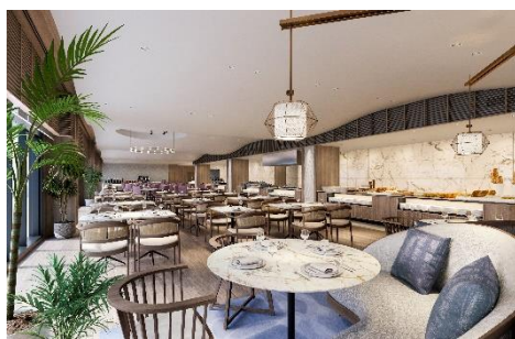
グランドメルキュール南房総リゾート&スパ レストランイメージ

その土地ならではの食材を活かし、歴史や文化とともに受け継がれてきた郷土料理はもちろんのこと、プチホットドッグやパンケーキといった自分好みにカスタマイズできる料理など、つい手を伸ばしたくなるような豊富なラインアップを用意しています。