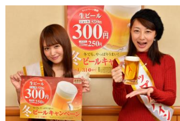
あなたは、ビールキャンペーンを利用したことがありますか？

吉野家での「ビールキャンペーン」は今回で4回目、前回の利用実態調査からキャンペーンの利用率が20歳代「46.8%」、30歳代「57.4%」、40歳代「31.9%」、50歳代「38.3%」、60歳代「19.0%」と、20・30歳代の若い層の利用率が高いことが判明しました。この調査結果からも、吉野家での若者の“ちょい呑み”が増加していることが示唆されています。