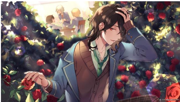
彩色: たくあんさん