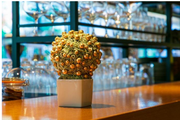
レストランバーエリアほか