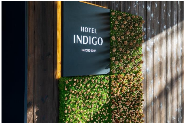
ホテルエントランス