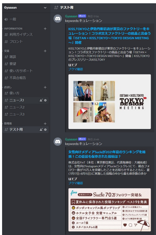
GyaaanがDiscordサーバ上で実際に動作している様子

また、Disordのサーバやチャンネルごとの通知情報をオン/オフすることで、Gyaaanの収集した情報全てをPCやスマートフォンに通知したり、優先度の高いカテゴリやジャンルをチャンネル単位で通知オン/オフすることなど柔軟な運用ができる。