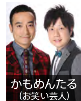
かもめんたる (お笑い芸人)