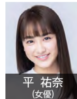
平 祐奈 (女優)