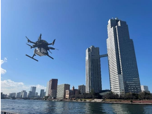
プロジェクトのイメージ (令和3年度のプロジェクトでの飛行の様子)

【プロジェクト実施者】 KDDI株式会社、KDDIスマートドローン株式会社、日本航空株式会社、東日本旅客鉄道株式会社、株式会社ウェザーニューズ、株式会社メディセオ