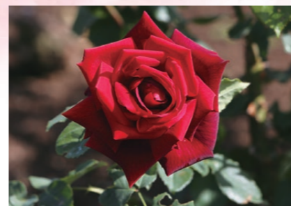
バラ「クイーン・オブ・神代」

問い合わせ 神代植物公園サービスセンター TEL:042-483-2300(9時~17時) ●公式HP「神代植物公園へ行こう!」 https://www.tokyo-park.or.jp/jindai/ ●公式Twitter「神代植物公園ニュース」 https://twitter.com/ParksJindai