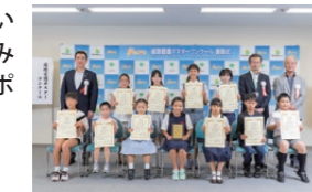
コンクール表彰式の様子

皆さんが普段「みち」に対して感じていること、思っていることを作品にしてみませんか? 「夢のみち」2023道路愛護ポスターコンクールの作品を募集します!