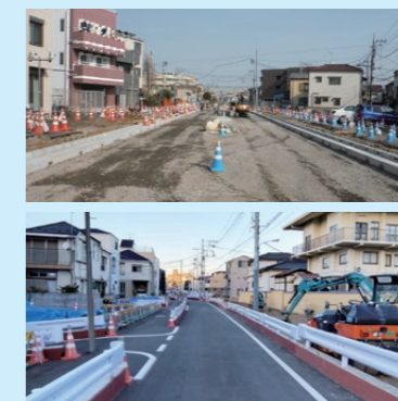
工事が進む特定整備路線(上:補助第136号線(足立区本木)(下:補助第144号線(江戸川区平井))