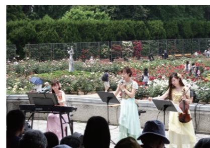
ばら園コンサート