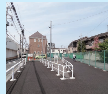
事業用地の有効活用(避難路等の確保)(補助第172号線(豊島区長崎))

問い合わせ先: 道路建設部街路課 TEL: 03-5320-5346 用地部用地課 TEL: 03-5320-5214