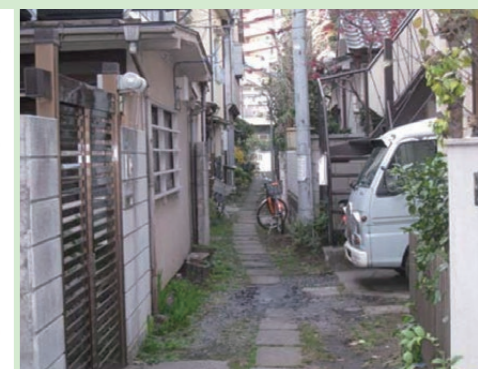
木造住宅密集地域の現状