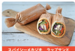
スパイシーメカジキ ラップサンド