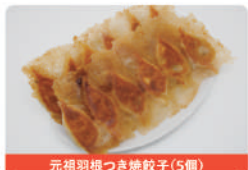
元祖羽根つき焼餃子(5個)