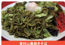
東村山黒焼きそば