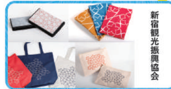
新宿観光振興協会