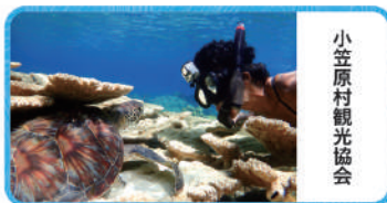
小笠原村観光協会