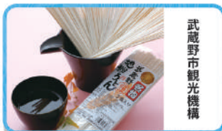
武蔵野市観光機構