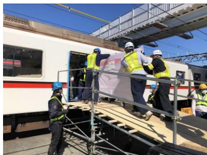
列車への積み込み（車両基地）

整備に当たっては、世界的な半導体不足の影響によりホームドアの製造に最大 10 か月遅れが出ましたが、各駅でホーム補強等の準備工事を着実に実施するとともに、設置後の動作確認手順の見直しや複数駅での同時施工、列車を使用したホームドアの搬入等の工夫により工程を大幅に圧縮し、早期の整備完了に努めました。