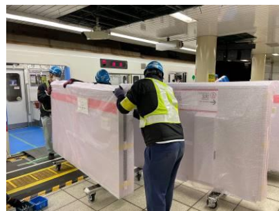
列車からの積み下ろし（駅）

営業中の路線で列車を使用しホームドアの搬入を行うことは今では一般的となっていますが、交通局では、初めて整備した三田線からこの方法を採用しています。