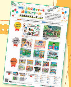
昨年度の受賞ポスター