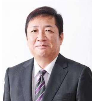
大熊 英司(おおくま えいじ)

一橋大学経済学部卒業後、1987 年にテレビ朝日に入社。数々のスポーツ実況、2006 トリノ冬季オリンピック代表実況(カーリング等)や ANN ニュースキャスターをこなす。