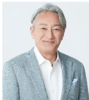
平井 一夫(ひらい かずお)

1984 年に株式会社CBS・ソニー(現株式会社ソニー・ミュージックエンタテインメント)入社。2012 年4月にソニー株式会社社長兼CEOに就任し、ソニーグループ全体のビジネスを牽引。2018 年4月より 2019 年6月まで会長を務める。2019 年6月より 2024 年6月までソニーグループ株式会社シニアアドバイザーを務める。2021 年4月、自ら代表理事を務める一般社団法人プロジェクト希望を設立。子どもたちの未来創造のきっかけとなる感動体験をつくるプロジェクトを推進している。