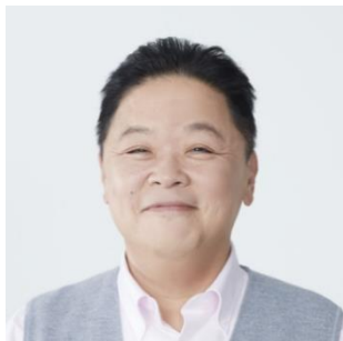
伊集院 光(いじゅういん ひかる)

1967 年生まれ。84 年に三遊亭楽太郎(六代目三遊亭円楽)に弟子入りし、落語家・三遊亭楽大として活動。87 年ごろから伊集院光としてタレント活動をはじめ、ラジオ番組のパーソナリティとして人気を博す。その後、「Qさま!!」(テレビ朝日)、「100 分 de 名著」(NHK Eテレ)に出演し、幅広く活躍。『のはなし』(宝島社)、『名著の話 芭蕉も僕も盛っている』(KADOKAWA)などの本も出版している。