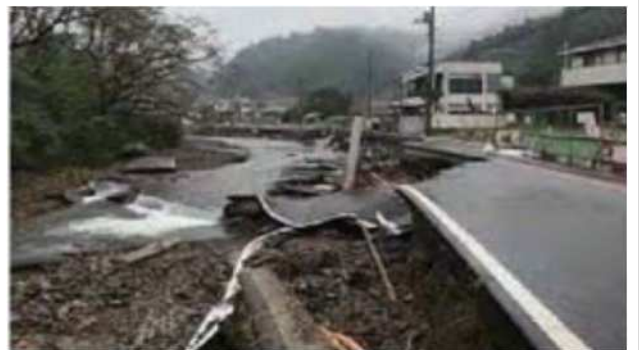
令和元年台風19号被災状況