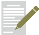
手書きの売上帳 のコピー