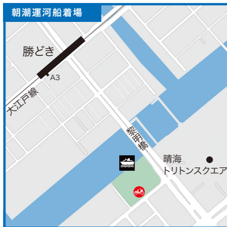
東京都中央区晴海3-1先 黎明橋下 区立黎明橋公園前●都営大江戸線「勝どき駅」A3出口より徒歩10分