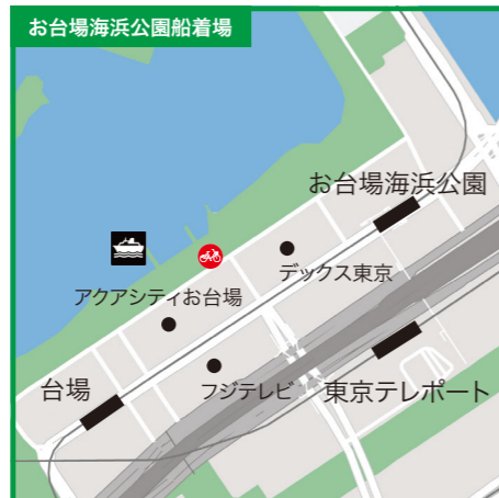
東京都港区台場1-4地先●ゆりかもめ「台場駅」または「お台場海浜公園駅」徒歩7分●りんかい線「東京テレポート駅」徒歩10分