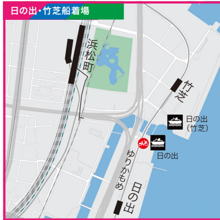
東京都港区海岸2-7-103地先●JR山手線・京浜東北線「浜松町」駅南口徒歩9分●新交通ゆりかもめ「日の出」駅東口徒歩4分