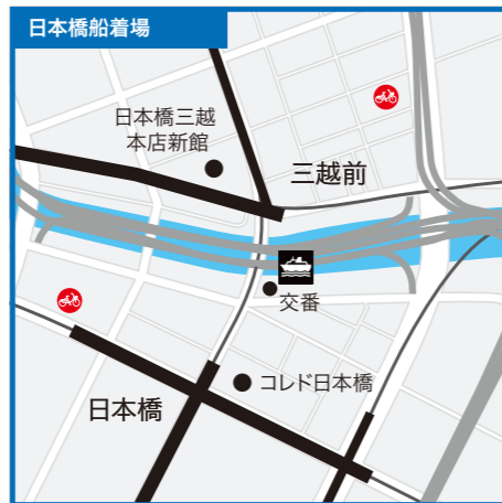
東京都中央区日本橋一丁目9番先(日本橋川)●銀座線・東西線・都営浅草線「日本橋駅」B12出口徒歩3分●銀座線・半蔵門線「三越前駅」B6出口徒歩1分