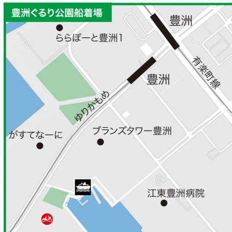
東京都江東区豊洲5丁目1番地先●ゆりかもめ「豊洲駅」から徒歩10分●ゆりかもめ「新豊洲駅」から徒歩7分