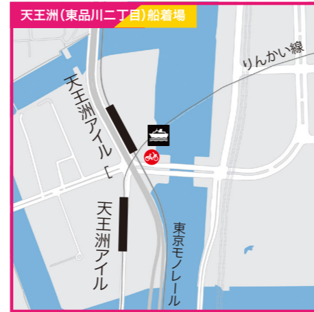
東京都品川区東品川2丁目3の2地先●東京モノレール「天王洲アイル」南口から徒歩1分●りんかい線「天王洲アイル駅」A出口より徒歩3分