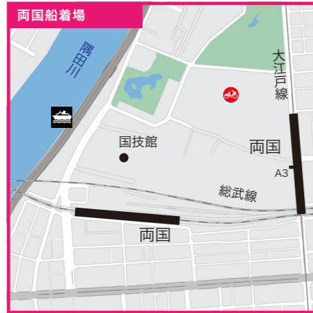
東京都墨田区横網1丁目地先●JR総武線「両国駅」西口より徒歩3分