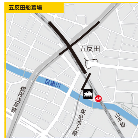
東京都品川区西五反田1丁目10番地先●JR山手線「五反田」駅徒歩5分、都営浅草線「五反田」駅徒歩5分●東急池上線「五反田」駅徒歩3分