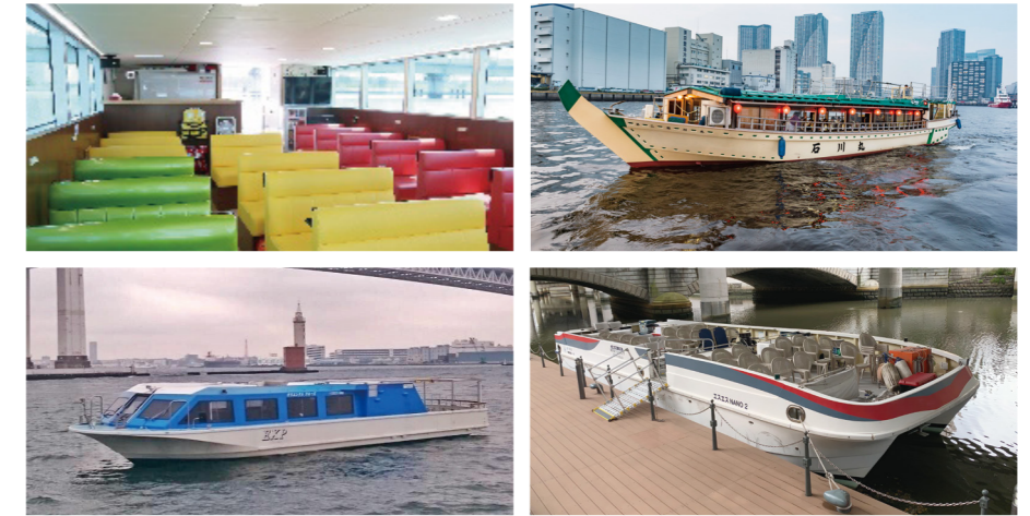
※船舶写真は一例です。使用される船のダイヤなど詳細はホームページをご確認ください。

東京都および品川区では、舟運が身近な観光・交通手段として定着し、水辺のにぎわいを創出するよう2016年度から取組を進めています。この取組の一環として、「らくらく舟旅通勤第2弾」を実施しますので、ぜひご利用ください。