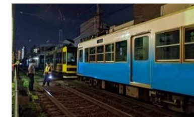
東京さくらトラム（都電荒川線） 車両避難訓練