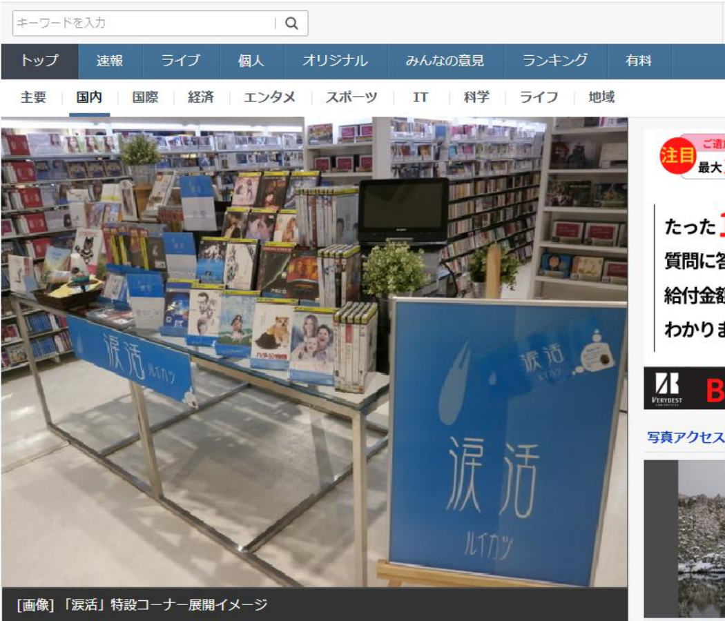
[画像] 「涙活」特設コーナー展開イメージ

YAHOO! JAPAN ニュース IDでもっと便利に新規取得 ログイン 毎月5のつく日更新 10%OFFクーポン!