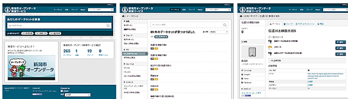
新潟市データカタログサイト「新潟市オープンデータ検索サービス」画面

オープンデータの利活用推進に有効となる、データの検索性向上および登録作業の効率化を実現